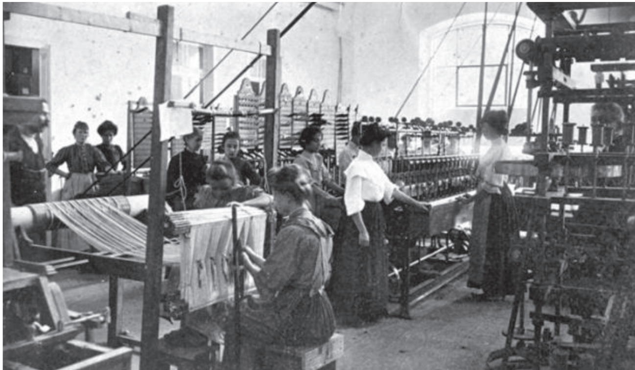
Interior de fábrica. s.l., s.d.

Reformistas ou amarelos: No movimento operário, durante as primeiras décadas do século XX, havia um agrupamento de correntes sindicais de caráter reformista muito heterogêneas entre si, mas que tinham em comum a luta pela melhoria das condições de