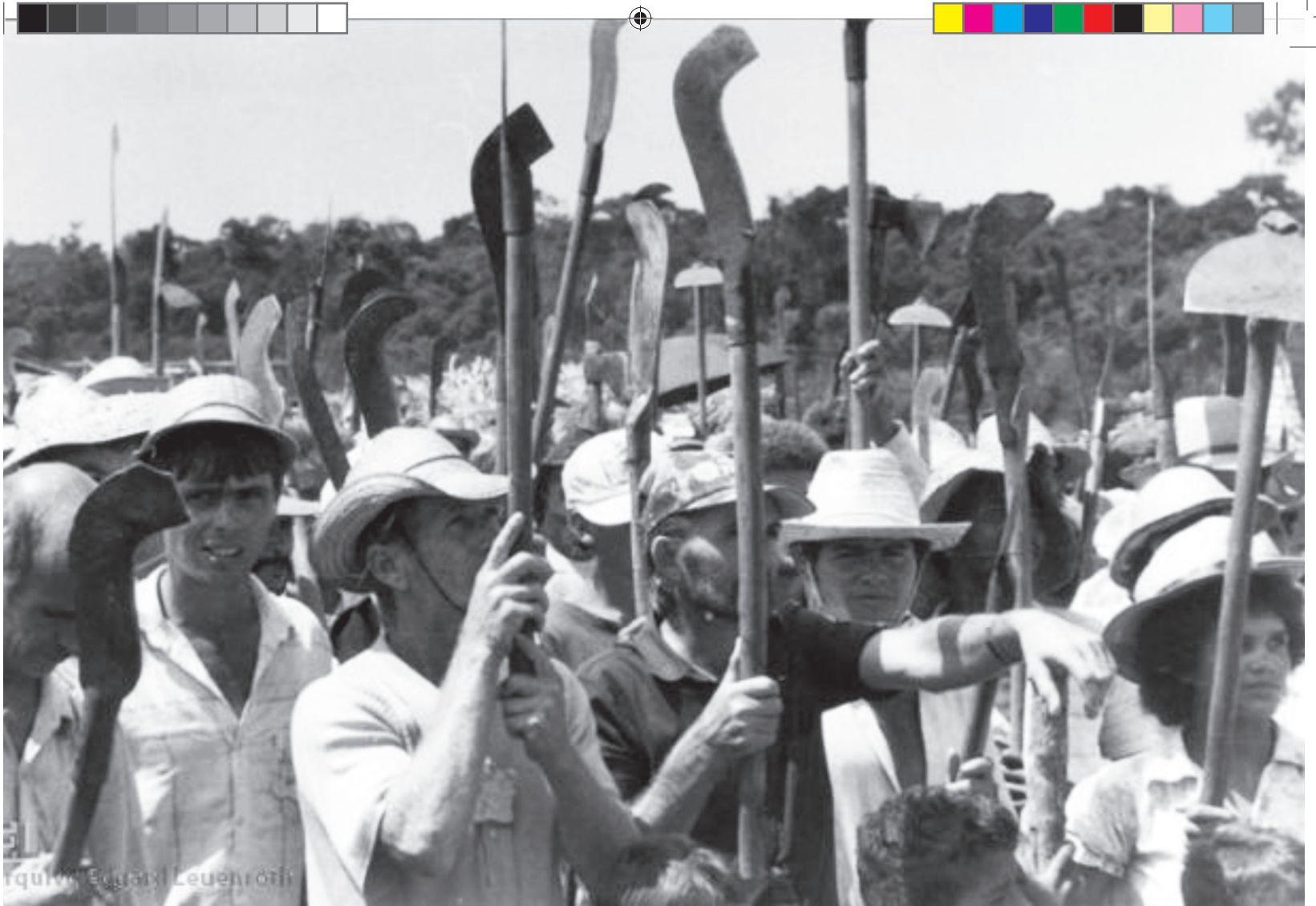
Trabalhadores rurais. Paraíba, s.d.

lado, as forças reacionárias que queriam a superação da crise econômica sem alterar a estrutura social do país, ou seja, um capitalismo selvagem concentrador de renda e dependente dos países centrais. Por outro lado, as forças democráticas e populares preconizavam um modelo de desenvolvimento domesticado pelos valores modernos da igualdade social e da radicalização da democracia através da participação política do povo consciente de seus direitos e politicamente ativo.