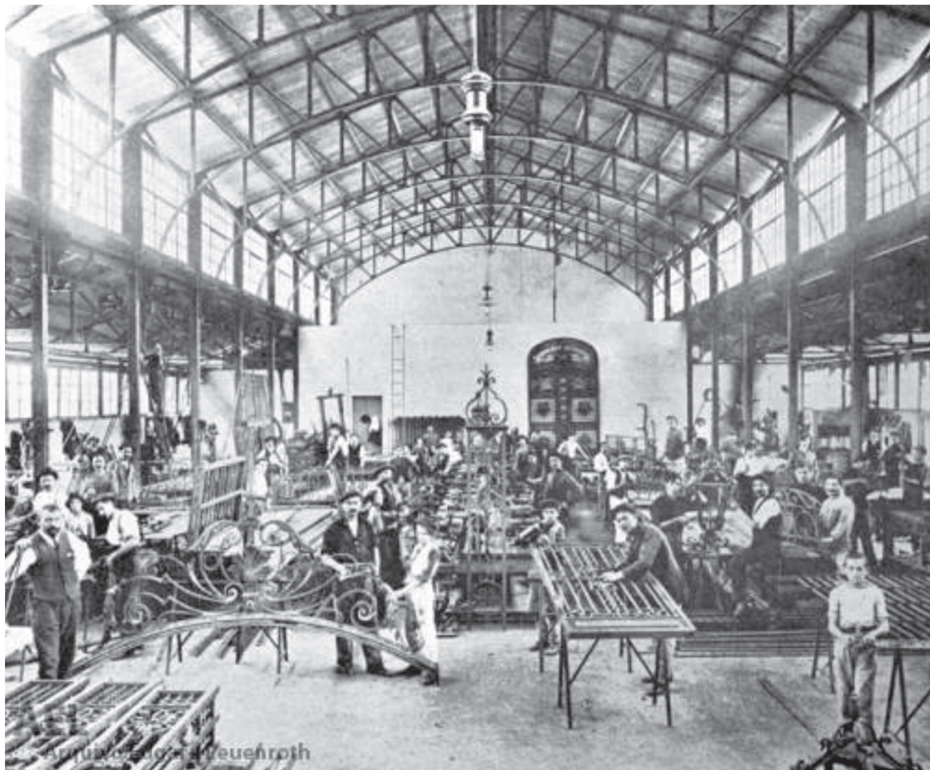
Oficina de trabalho artístico com ferro, São Paulo/SP, 1924.