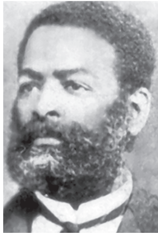
Luiz Gama

Para os senhores de terra e escravos e para as elites políticas da época, se tratava de virar a página da história, como se isso fosse possível. Pelo menos é o que indica a total ausência de políticas de integração do negro na sociedade e na vida econômica do país e o