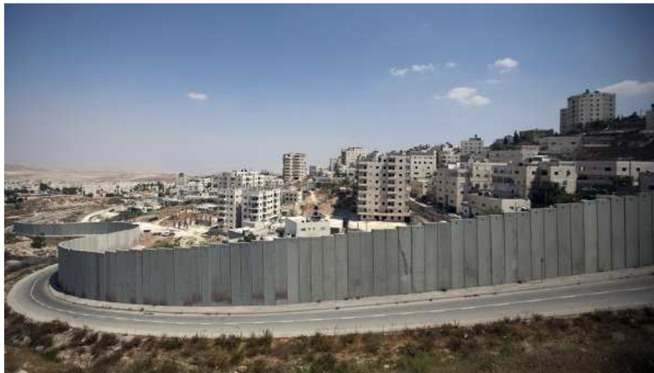
Muro de la Vergüenza: Apartheid a la manera del Estado de Israel con la construcción del muro de 7 metros de alto y 700 km de largo. (En: http://xurl.es/39fjs )

b) El intento de la Alemania nazi , de demostrar la existencia de la "raza aria", y la imposición de la Teoría del Lebensraum, como justificativo de la expansión hacia el este de Europa y Asia Central, que terminó con el hundimiento del Tercer Reich.