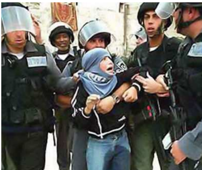
La soldadesca israelí atropella, golpea, viola, quebranta y aterroriza, en particular, a niñas y niños palestinos desarmados. En la foto, seis soldados golpean y humillan a un niño.

Es un Estado agresor, nazi-fascista y de actitud bélica permanente.