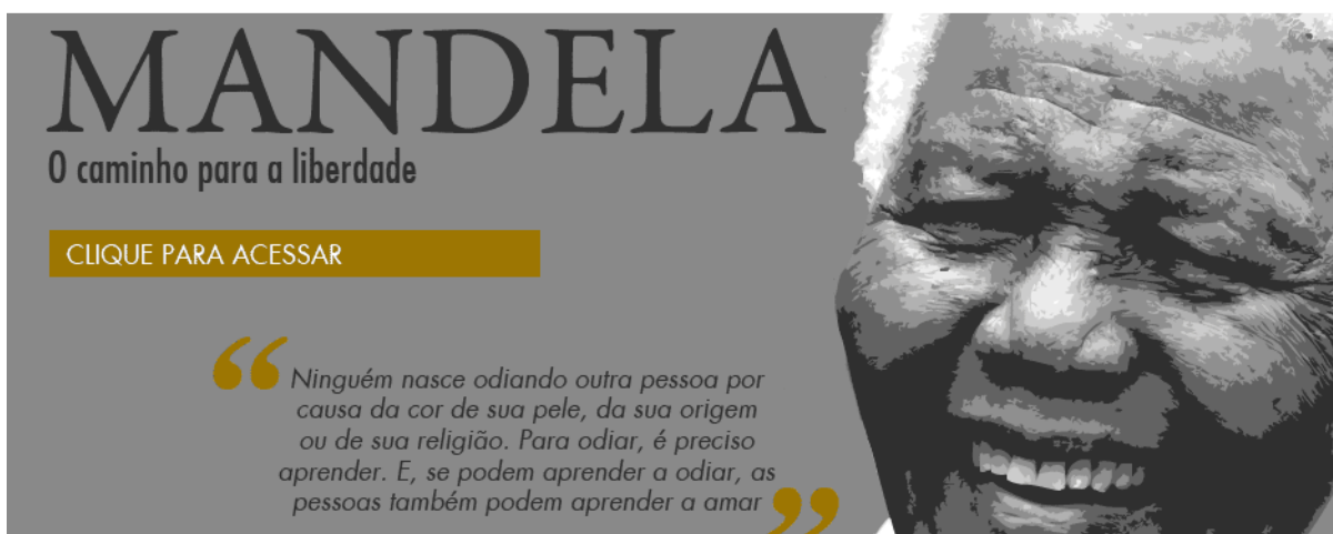
Nelson Mandela

Nelson Mandela dijo que el Apartheid fue un mal para Sudáfrica, y también es un mal en Palestina.