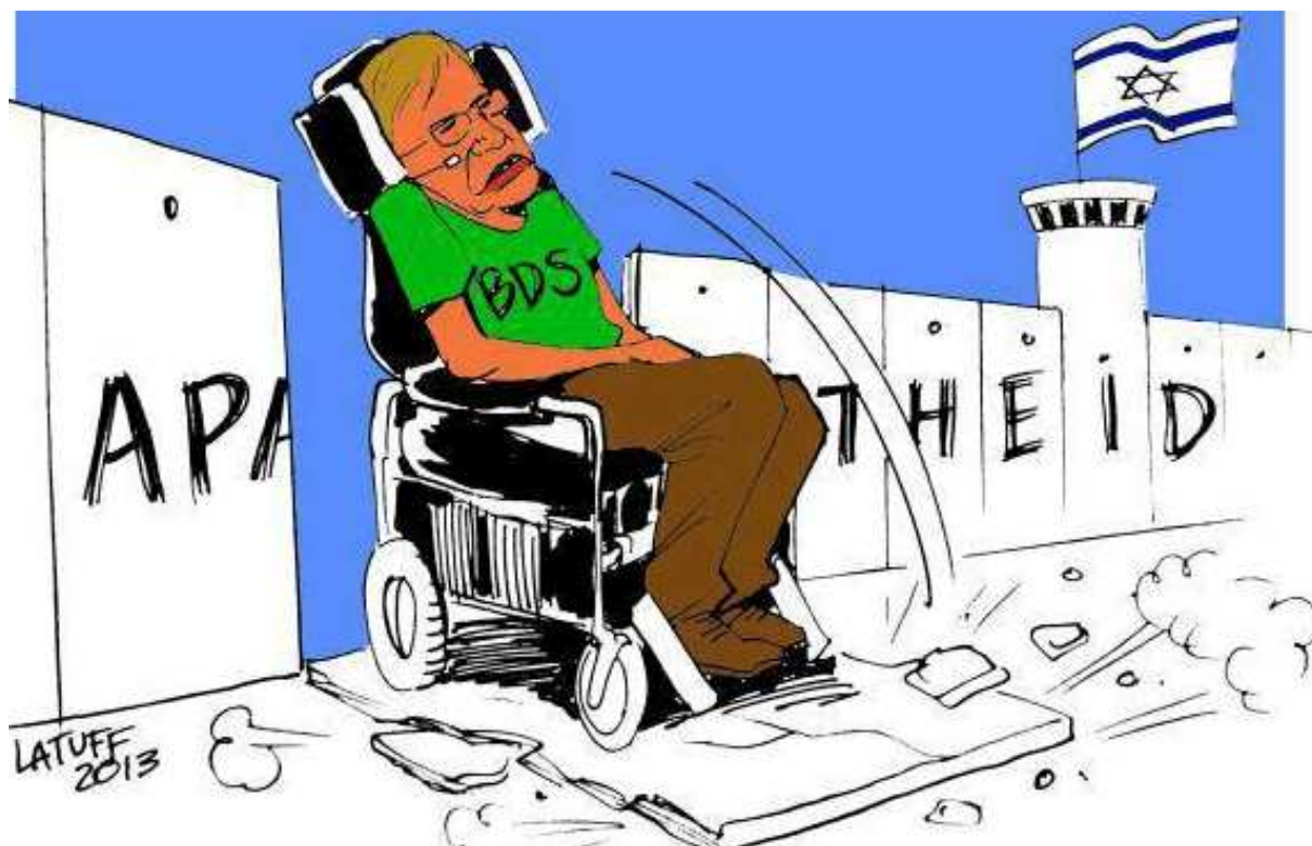
Latuff y la repulsa del científico británico Stephen Hawking (En: http://xurl.es/cdffl )

En repudio al Apartheid mantenido por el Estado de Israel en contra de Palestina, el científico británico Stephen Hawking decidió sumarse al boicot académico a Israel, y no participar en unas conferencias del 18 al 20 de junio del 2013, en Jerusalén.