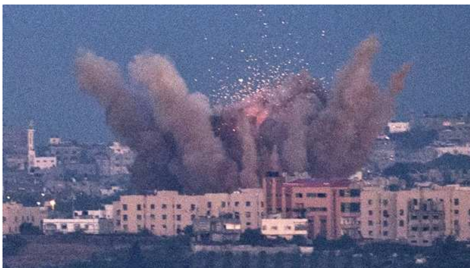
Gaza: bombardeo israelí con bombas de fósforo blanco y uranio empobrecido

Como iniciativa última de los países árabes de parar el éxodo palestino, enviaron a Palestina sus ejércitos el 15-05-1948. El 15-07-1948, la ONU ordenó una tregua definitiva entre Israel y los Árabes, con la que el estado de Israel pudo anexionar más territorio del que le correspondía por la Res. "181".