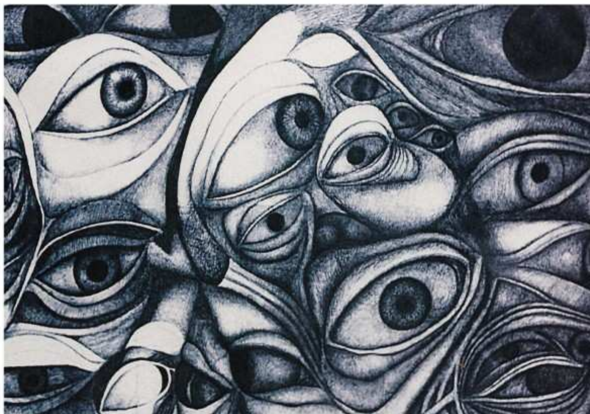
Dibujo de Selmo Martínez

Están buscando a Ana Frank están pidiendo documentos en la calle están tomando fotos, señalando y dando listas; están delatando y disparando a la gente, están sobrevolando con helicópteros y asesinando opositores. Están exterminando pueblos y población campesina, están montando falsa guerrilla y marchando a la guerra.