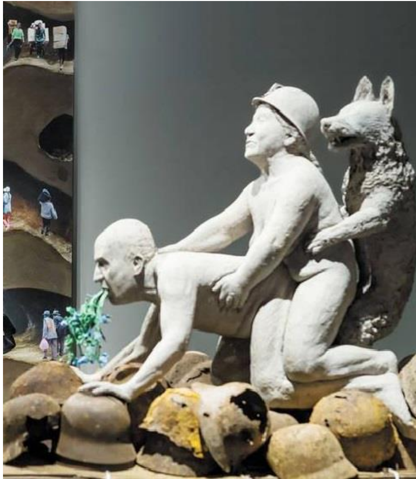
La escultura de la artista austríaca Ines Doujak, con Juan Carlos de Borbón sodomizado por una obrera militante bolivariana

En efecto, el 18-03-2015, varias publicaciones divulgaron que "La exposición 'La bestia y el soberano' del Museo de Arte Contemporáneo de Barcelona (MACBA) ha sido cancelada...", aduciendo una razón timorata y elusiva, por parte de la dirección del museo.