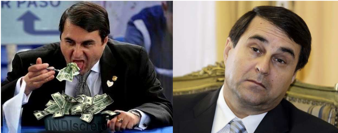
Ex-funcionario Federico Franco Gómez, 'El Breve', golpista, mediocre y ladrón.