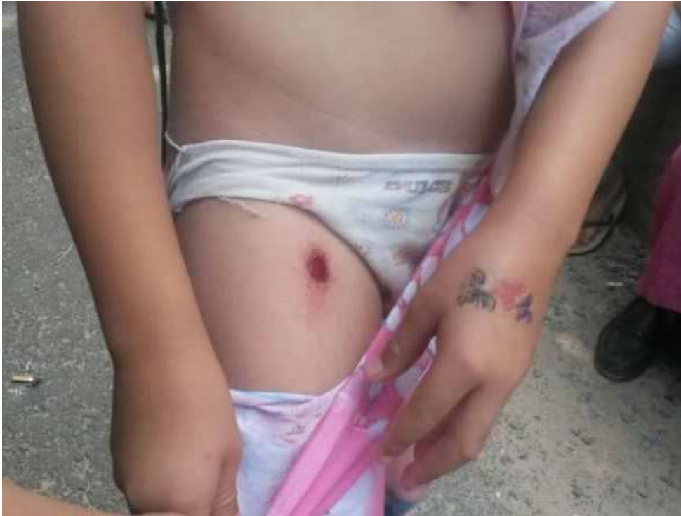
Represión policial salvaje: niña de 8 años, recibió 4 balas en el cuerpo (11-12-2013)

Estos indicios concretos de la presencia de mercenarios israelíes, muestran la puesta en marcha de un proceso de "palestinización" en Paraguay, para conducir a la ciudadanía al mismo umbral de sojuzgamiento, saqueo y quebranto mantenidos por el Estado nazi-fascista de Israel, sobre el noble Pueblo Palestino, desde hacen más de 65 años.