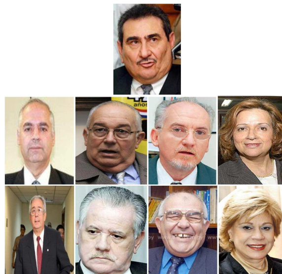
Camarilla de ministros de la Corte Suprema, que administra (In)Justicia

Desde el Poder Judicial, con sus ministros ignorantes pero codiciosos, sus jueces mediocres, sus fiscalas angurrientas y sus fiscales rascabuches, todos en situación civil de alquiler permanente y a disposición de los intereses de los poderosos, siguen administrando Injusticia.