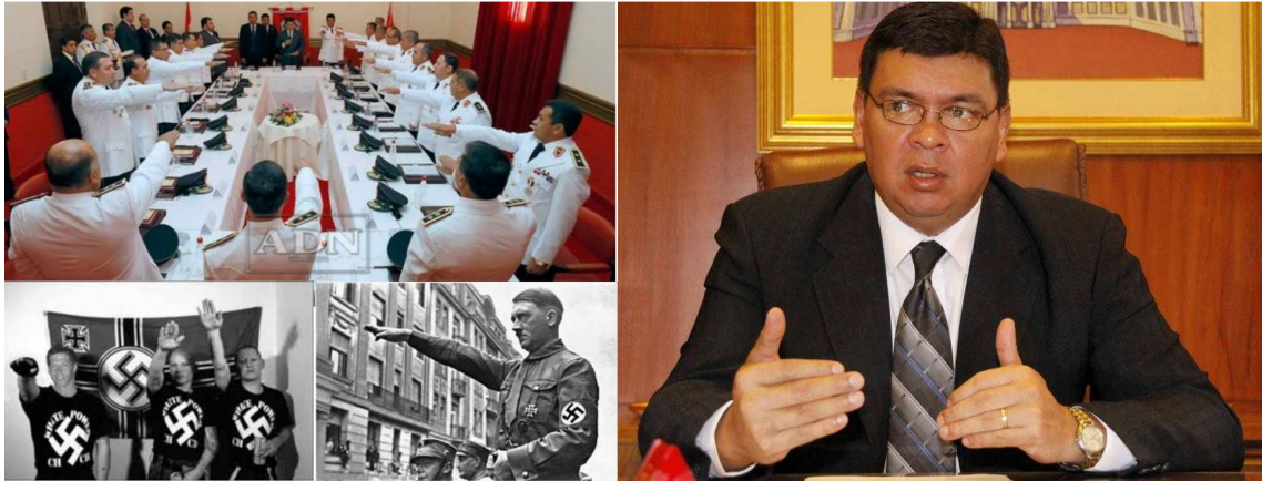
Cúpula policial saluda al estilo nazi al presidente Cartes (06-11-2013).

Desde el Poder Ejecutivo, con el presidente Horacio Cartes, El Primitivo, y el ministro del Interior Francisco De Vargas, El Cobarde Ignorante, con la Ley de la Fuerza ejercida por la policía y el ejército, asesinan a campesinos inocentes, garrotean a la Ciudadanía, queman escuelas, aterrorizan a la niñez y se preparan para subastar y dejar en manos de las transnacionales fascistas, a precio vil, los Recursos Naturales del país.