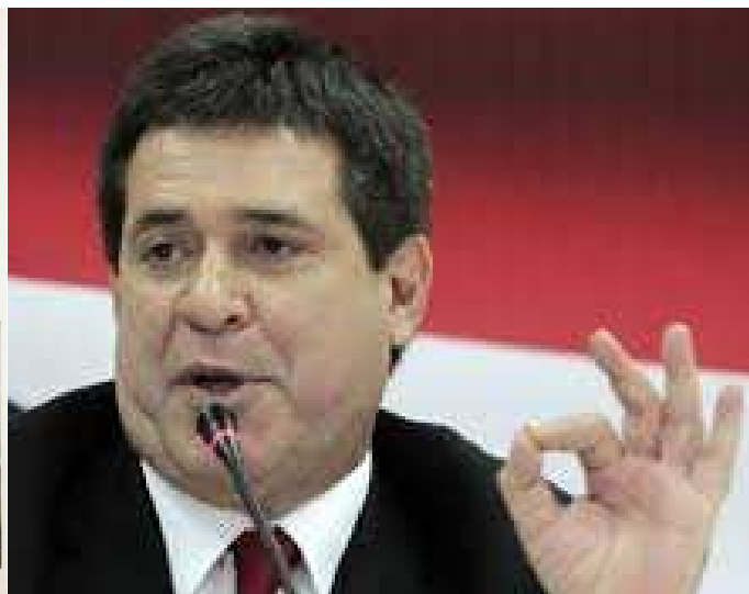
Horacio Cartes, El Primitivo