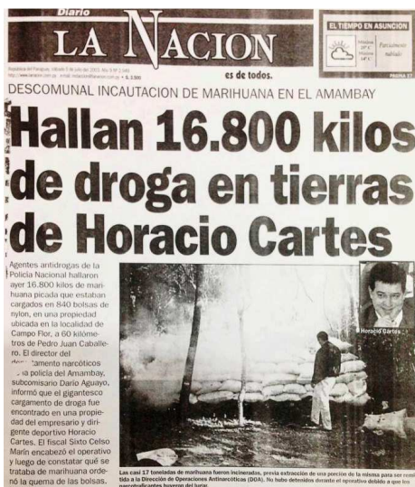
Tapa de diario (05-07-2005)

Tanto en la Masacre de Kuruguaty, como en el asesinato, hasta ahora, de otra docena de líderes campesinos, participó un comando de mercenarios asesinos del Mossad, del Estado racista de Israel, con quien el actual presidente Horacio Cartes mantiene una agenda oculta, al punto de que su "anillo de seguridad", está a cargo de estos criminales. Quizá sea porque la "hoja de vida" de Cartes, en rigor es un extenso prontuario policial con antecedentes de narcotráfico y lavado de dinero.