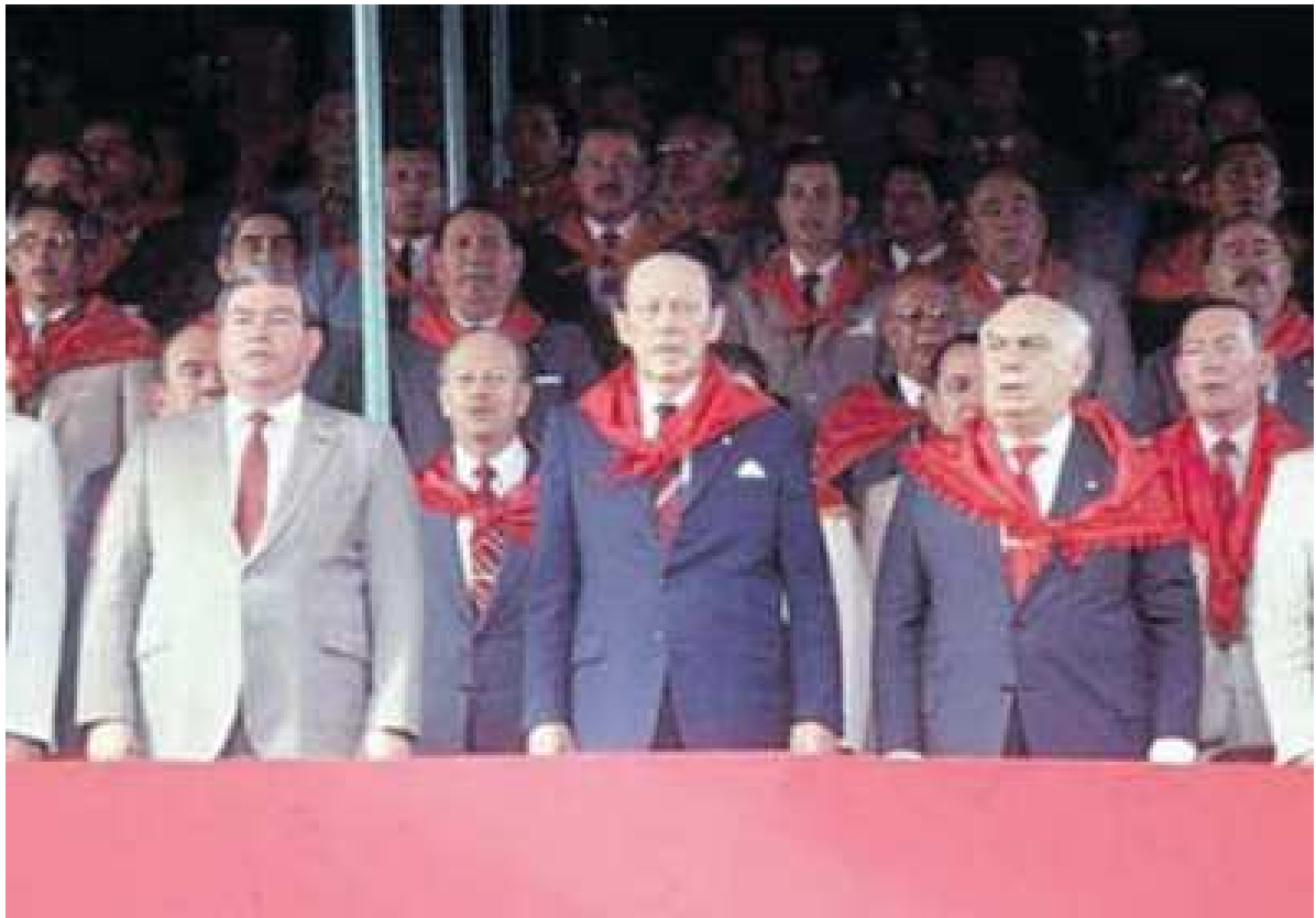
El genocida y ladrón Alfredo Stroessner y Chanchito Montanaro en un acto protocolar en la junta de gobierno del partido colorado (1987).

En 1963, el déspota y ladrón Alfredo Stroessner nombró a Chanchito al frente del Ministerio de Justicia y Trabajo, hasta 1966.