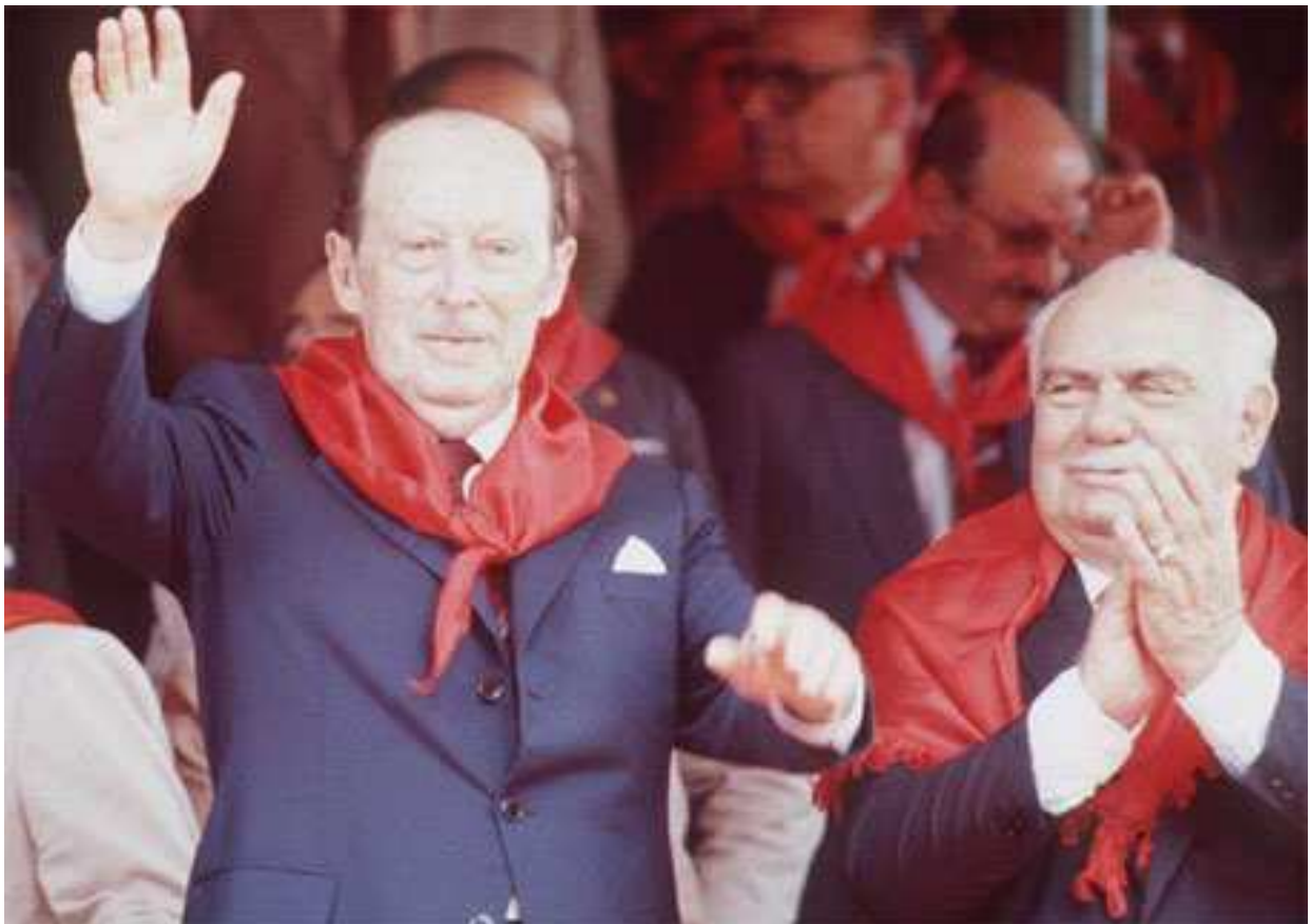
El déspota y ladrón Alfredo Stroessner . A su lado, Chanchito .

Los grupos eran previamente alcoholizados, y quedaban dispuestos a reprimir todo tipo de clamor popular o manifestaciones públicas, y cometer diversas tropelías como atropello a las ligas agrarias, centros educativos, iglesias, clubes y casas de particulares.